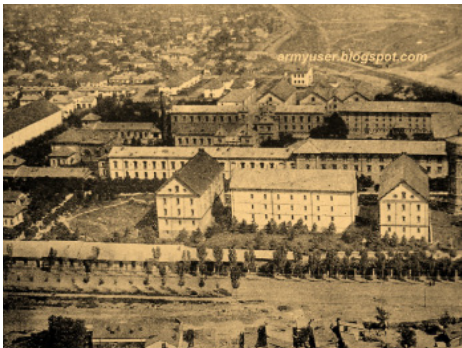
MANUFACTURA DE TUTUN (BELVEDERE) MANUFACTURE DE TABAC (BELVEDERE) TORACCO FACTORY (BELVEDERE)

http://bucuresti.tourneo.ro/wp-content/uploads/2012/03/manufactura-belvedere-1926.jpg